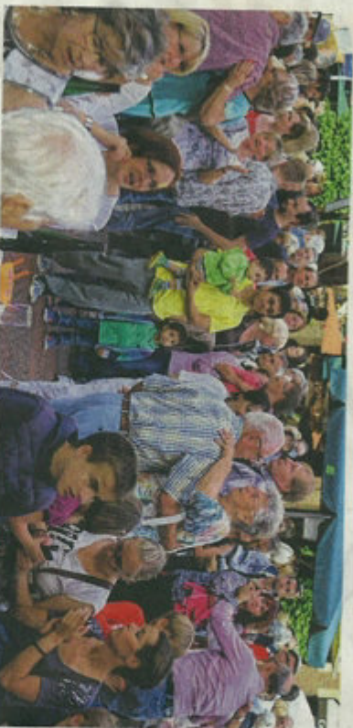
Das Gläschen Wein abstellen und los auf die „Tanzfläche Morlauplatz“.