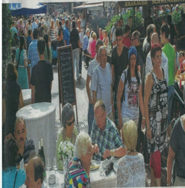
Auf dem Weinfest locken Wein, kulinarische Genüsse, musikalische Größen und natürlich die Talentshow.

zusammen. Wo geht das besser als auf dem Würselener Weinfest?“, betont Taghadossi. Die Würselener Geschäftswelt lädt am 7. August zum verkaufsoffenen Sonntag in die Innenstadt und den Gewerbepark Aachener Kreuz ein. Von 13 bis 18 Uhr werden die Kunden einen ganz besonderen Einkauf erleben. Auch in diesem Jahr gilt wieder sowohl beim Shoppen als auch beim Weinfest das Credo „Klasse statt Masse“. Beginn ist am Freitag, 5. August, ab 16 Uhr, bevor das Weinfest um 19 Uhr offiziell eröffnet wird. Startenor und Kenner der welt-